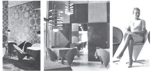
Verner Panton: „Cone Chair“, 1958, Gesamthöhe: 81 cm, Sitzhöhe: 46 cm, Breite: 57 cm, Tiefe: 65 cm